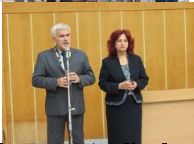
Българският консул в Рим и кметът на община Разград бяха първите посетители на първия